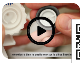
Maintenance membrane 95L