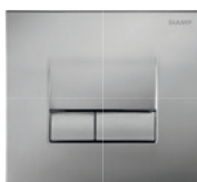
100% Brossé satiné opaque Ref. : 31 1873 60