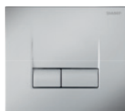
100% Aspect chromé mat clair Ref. : 31 1872 60