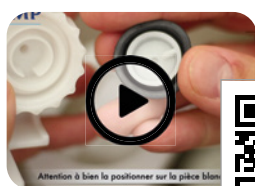
Maintenance membrane 95L