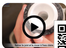
Maintenance clapet mécanismes SIAMP