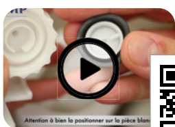
Maintenance membrane 95L